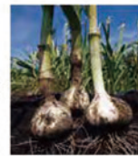
▲「たっこにんにく」【地産田産】団体商標登録(東北第1号)、6月には収穫祭が開催される

田子町(たっこまち)は、秋田・岩手両県に接する青森県奥羽南端の町。町の主要産業は「たっこにんにく」を代表とする農業で、田子牛を中心とする畜産にも力を入れている。奥羽山脈山麓に広がる自然とそこで営まれる人々の暮らしは日本の原風景を思わせ、2015年10月、日本で最も美しい村」連合に加盟登録された。国際交流も盛んで、米国ギリロイ市と姉妹都市提携を結んでおり、町のイベントでは多数の外国人が町民とともに楽しむ姿が見られる。