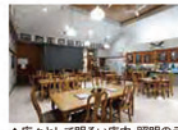
▲広々として明るい店内、照明のランブシェードもニンニクのデザイン