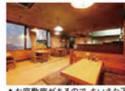
▲お座敷があるので、美しい女子供連れやグループで訪れても安心