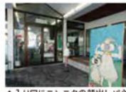
▲入り口にニンニクの顔出しパネル、館内にはギフトショップもある