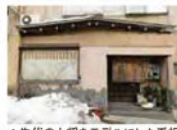
▲先代の大将をモデルにした看板が目印、実は今の大将もそっくり