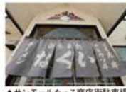
▲サンモールたっこ商店街駐車場が目の前、車を停めたら30秒で到着