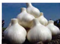
▲大ぶりで真っ白く、ふっくらふくよかな福地ホワイト六片種のニンニク