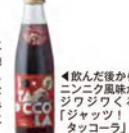
▲飲んだ後からニンニク風味がジワジワくる「ジャウツ」タッコラ

土づくりから取り組んできたたっこにんにくは、今は、日本一のニンニクといわれる地域の宝。フルーツを凌駕するほど糖度が高く、メロン14～15%に比し、たっこにんにくはなんと40%! 熱を通すと辛みの酸に隠れた甘みが出てきて、はっぴりとしてやさしい味わいになる。