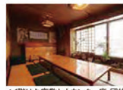
▲1階はお座敷とカウンター席、団体の場合は2階のお座敷を予約可能